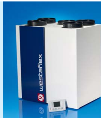
ZENTRALGERÄT WAC 300 / WAC 400