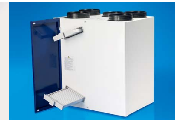
ZENTRALGERÄT WAC 300 / WAC 400