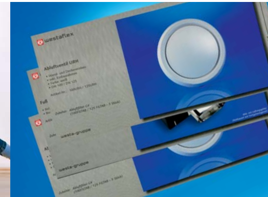
DAS PLANUNGSKARTENSYSTEM VON WESTAFLEX